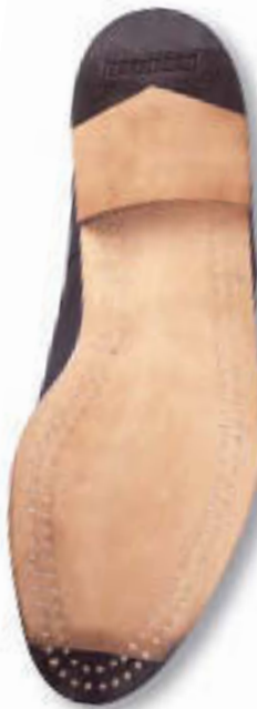
..... 8 mm Ledersohle mit Gummispitze für alle Modelle .. 09