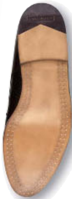
..... Ledersohle 5 mm .. 00 8 mm .. 08