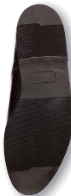
..... Gummisohle fein .. 25