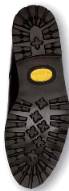
..... Gummisohle grob .. 20